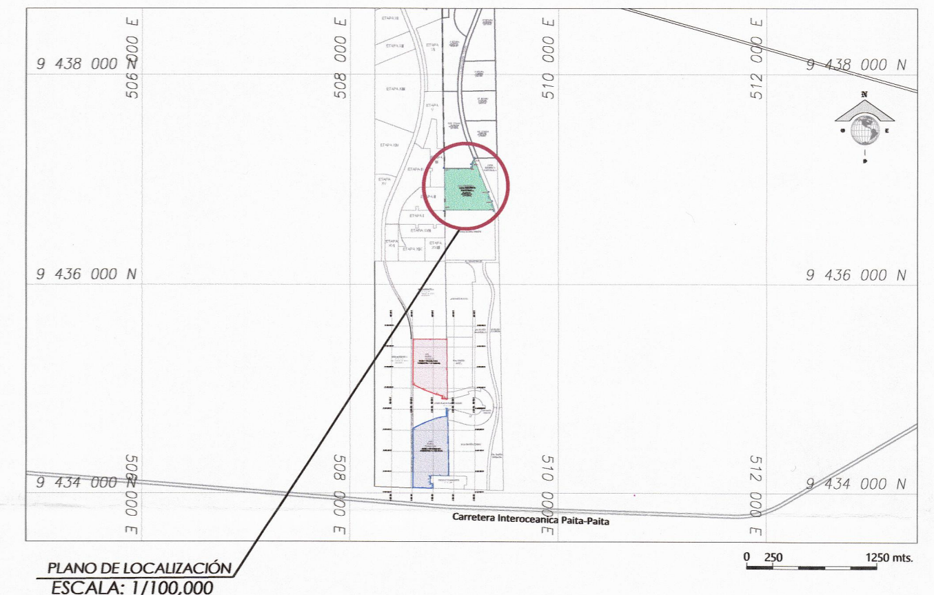
CUADROS DE COORDENADAS

AREA = 161,580.89 m2/ 16.1581 Ha PERIMETRO = 1,747.19 ml. SISTEMA DATUM WGS 84 - ZONA 17 SUR