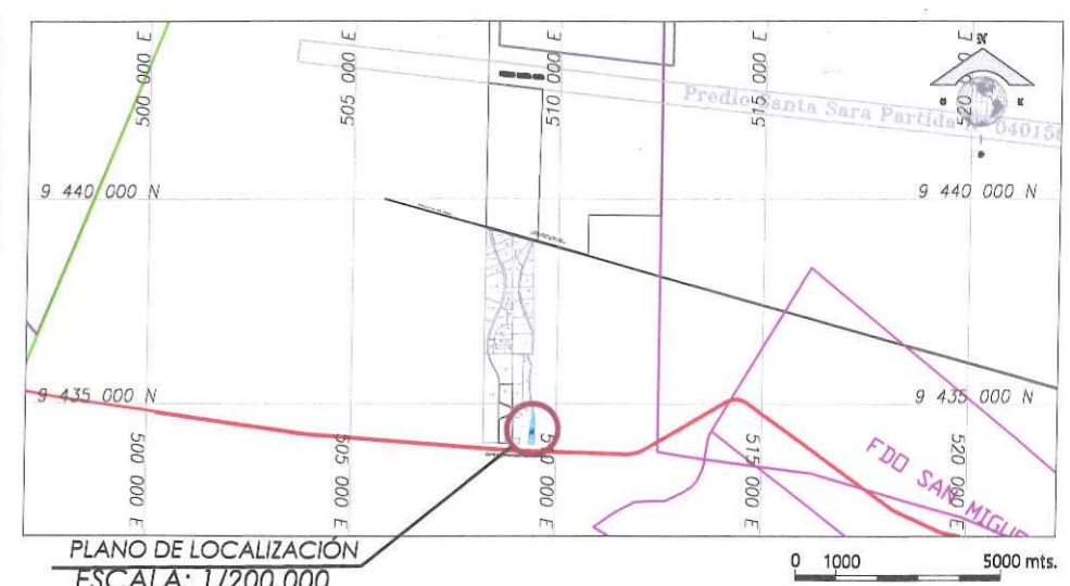
CUADRO DE COORDENADAS DE SUBLOTE IB - TAHITI - 6ta BAHIA DORADA

AREA = 72,780.45 m 2 / 7.2780 Ha PERIMETRO = 1,751.06 ml. SISTEMA DATUM WGS 84 - ZONA 17 SUR